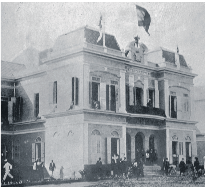
Detalle de la fachada principal el día 1 de enero de 1912, fecha de la inauguración.