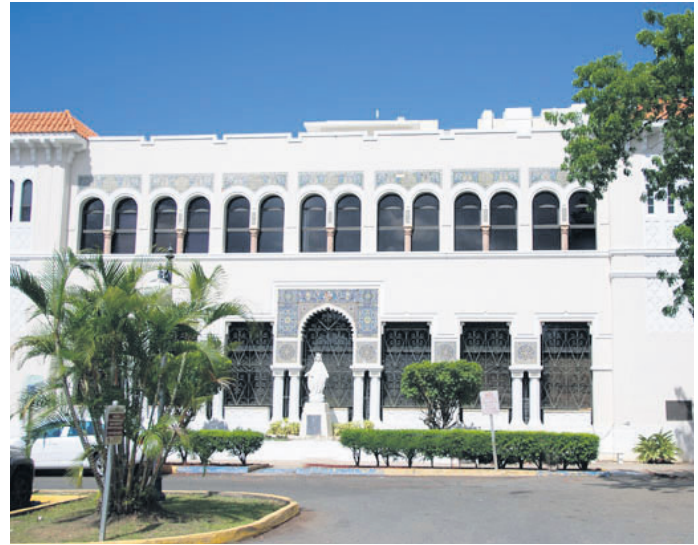
El hermoso edificio, de estilo Mudéjar, llamado "Departamento de Señoras" o "Maternidad".

El hermoso edificio, de estilo "Mudéjar", destinado al así llamado "Departamento de Señoras" o "Maternidad", fue inaugurado el día 26 de septiembre de 1926. La elegancia de su estructura y detalles, tanto exteriores como interiores, aún causan admiración por su belleza. Tanto los azulejos del Hall y la escalera, como los que engalanan los arcos de la fachada, se fabricaron en España, expresamente para este edificio.