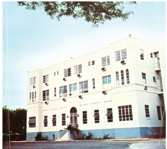
Edificio San Vicente, 1965

En mayo de 1952 se inaugura la nueva ala derecha del edificio, de diseño y construcción moderna, con 24 habitaciones destinadas a pacientes de cirugía, 4 salas de operaciones y las instalaciones complementarias; y años más tarde, el día 31 de marzo de 1965, se inauguró una tercera planta, al norte, el Departamento de Medicina, bautizada con el nombre de "San Vicente". Este proyecto fue construido con ayuda del Gobierno Federal.