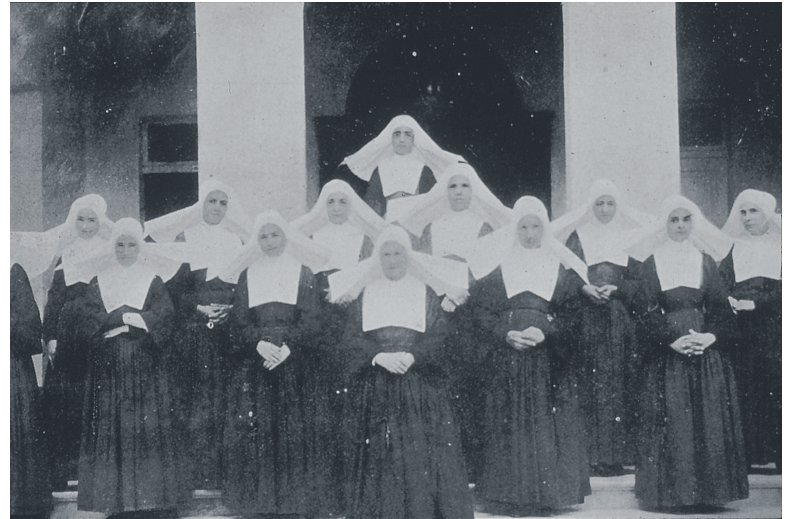
Entrañable grupo de Hijas de la Caridad, todas con título de Enfermeras Graduadas, que conformaba la Comunidad Religiosa del nuevo Sanatorio Auxilio Mutuo.