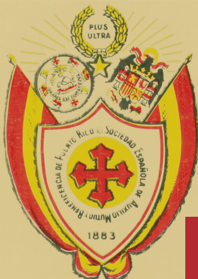
Emblema oficial de la Sociedad Española de Auxilio Mutuo y Beneficencia de Puerto Rico durante el periodo comprendido entre los años 1939 al 1972.

Velar que todos nuestros Socios tengan acceso a la más completa gama de servicios médicos hospitalarios prestados con los más rigurosos estándares de excelencia regidos por los principios de apoyo mutuo, beneficencia, caridad y principios de cristiandad.