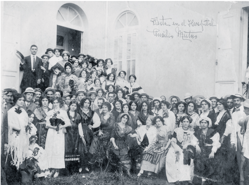
Grupo de señoritas y caballeros ataviados con los trajes típicos de España y Puerto Rico, que dieron lucimiento en los actos inaugurales del Sanatorio Auxilio Mutuo.

El programa de actos de este gran acontecimiento social, se inició con una solemne misa y bendición de los locales a cargo del Obispo de San Juan al que, según subrayó la prensa, asistieron cerca de seis mil personas, entre ellas, más de dos mil españoles. Destacó por su belleza y colorido, el desfile del distinguido grupo de señoritas de la alta sociedad de San Juan, ataviadas con los trajes típicos de diferentes pueblos de la Isla, así como de las cuarenta y nueve jóvenes que representaban a todas las provincias de España. Fue un espectáculo muy emotivo, escenificado en los jardines y estanque de la fachada principal del Sanatorio, donde no faltaron los típicos bailes locales que se hermanaron con las jotas, muñeiras, sevillanas, pasodobles y otros ritmos de la madre Patria.