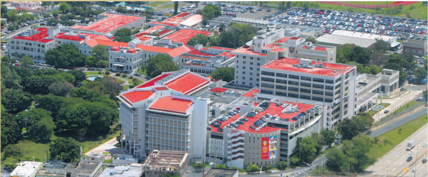
Perspectiva aérea actual del Hospital Español Auxilio Mutuo.

La referencia biográfica e histórica de esta importante etapa del desarrollo del Auxilio, que tendría como punto de partida la citada década de los setenta, será objeto de otros artículos de información en próximas ediciones de SocioNoticias , para que todos los Socios se familiaricen con la enorme importancia que ha tenido y sigue teniendo esta Institución, la Sociedad Española de Auxilio Mutuo y Beneficencia de Puerto Rico y su principal legado, el Hospital Español Auxilio Mutuo, cuya familiar silueta de su edificio principal, ha sido por estos cien años un símbolo de prestigio, nostalgia de un pasado y referencia de tradición y servicio a sus Socios y a la comunidad en general.