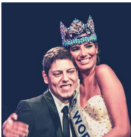
Miss Mundo 2016, Stephanie Del Valle junto a paciente pediátrico de 19 años, en lista de espera para trasplante de riñón.

la recaudación de fondos para establecer la primera unidad pediátrica de trasplante multiórganos en Puerto Rico. SN