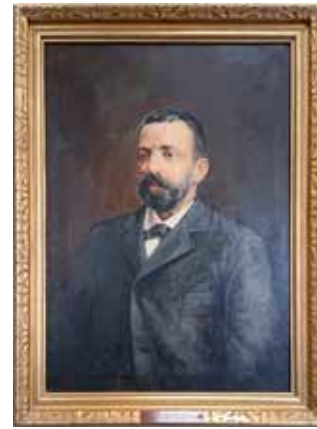
Oleo de Don Severo Ochoa, ubicado en el Salón de los Presidentes de la Junta de Síndicos de la Sociedad Española de Auxilio Mutuo y Beneficencia de Puerto Rico.