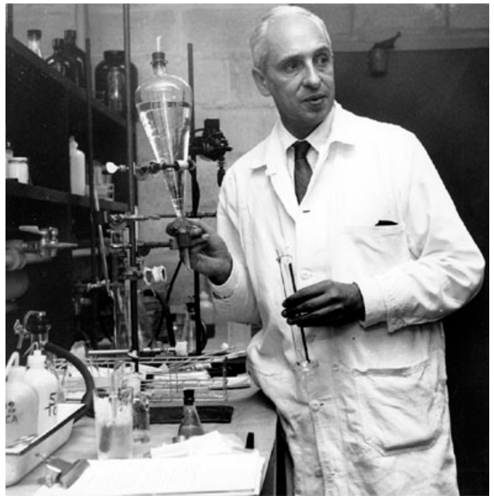
Severo Ochoa en 1959.

Mientras trabajaba en Nueva York, le concedieron la ciudadanía estadounidense, conservando su ciudadanía española y nunca renunciando a su amor por España, país que visitaba una vez al año de vacaciones. Él tenía interés en regresar a trabajar a su patria, pero al proponerse su nombre para dirigir el Centro de Biología Molecular, el entonces Presidente español Carrero Blanco dictaminó: "No procede el nombramiento porque Ochoa es masón", razonamiento absurdo y además incorrecto. Sin embargo, dado el prestigio de su Premio Nobel, el mismo Generalísimo Francisco Franco avaló el nombramiento y el gobierno le construyó el Centro de Biología Molecular Severo Ochoa,